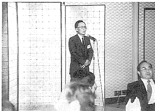
長谷理事長のあいさつ

引続いて3階松竹東の間に室屋を移して、出席者全員で懇親会を催し、お互いに親交を深められ成功裡に終了いたしました。