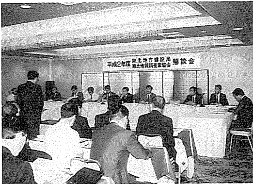
ご出席いただいた 東北地方建設局の皆様方