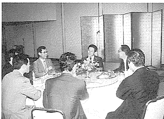
▲ 宴たけなわ ▶